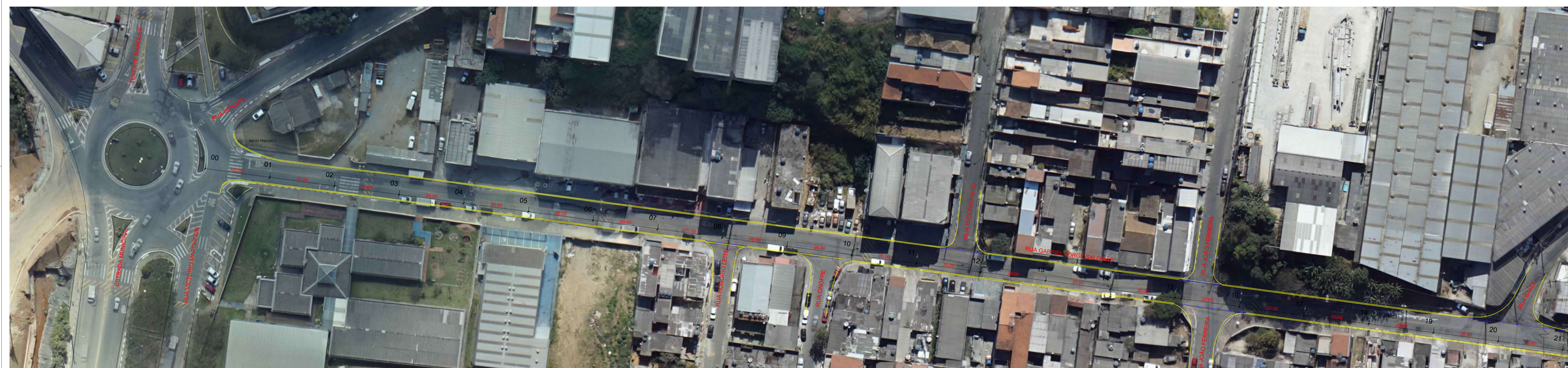
PLANTA DE ESTAQUEAMENTO - TRECHO 1 ESCALA 1:500