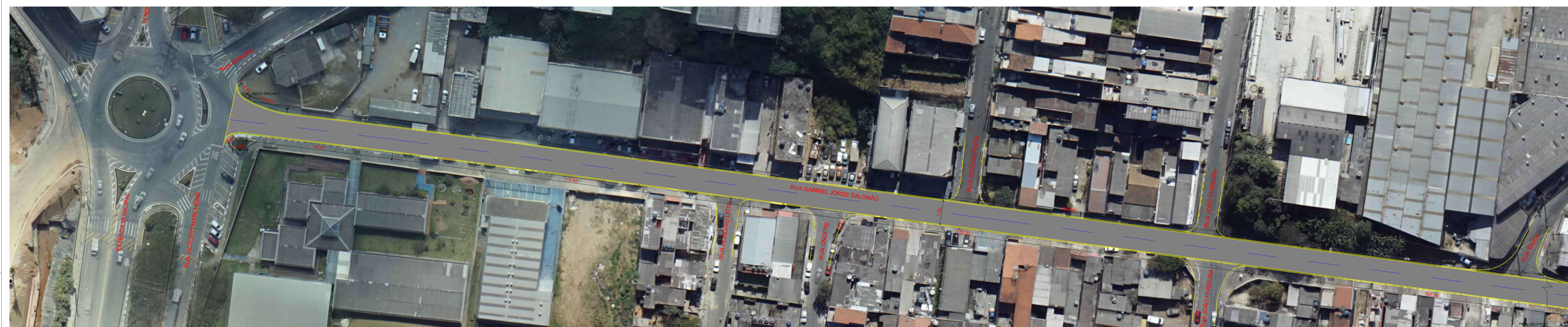
PLANTA DE RECAPEAMENTO - TRECHO 1 ESCALA 1:500

NOTAS PARA A EXECUÇÃO, AS MEDIDAS DEVEM SER CONFERIDAS NO LOCAL.