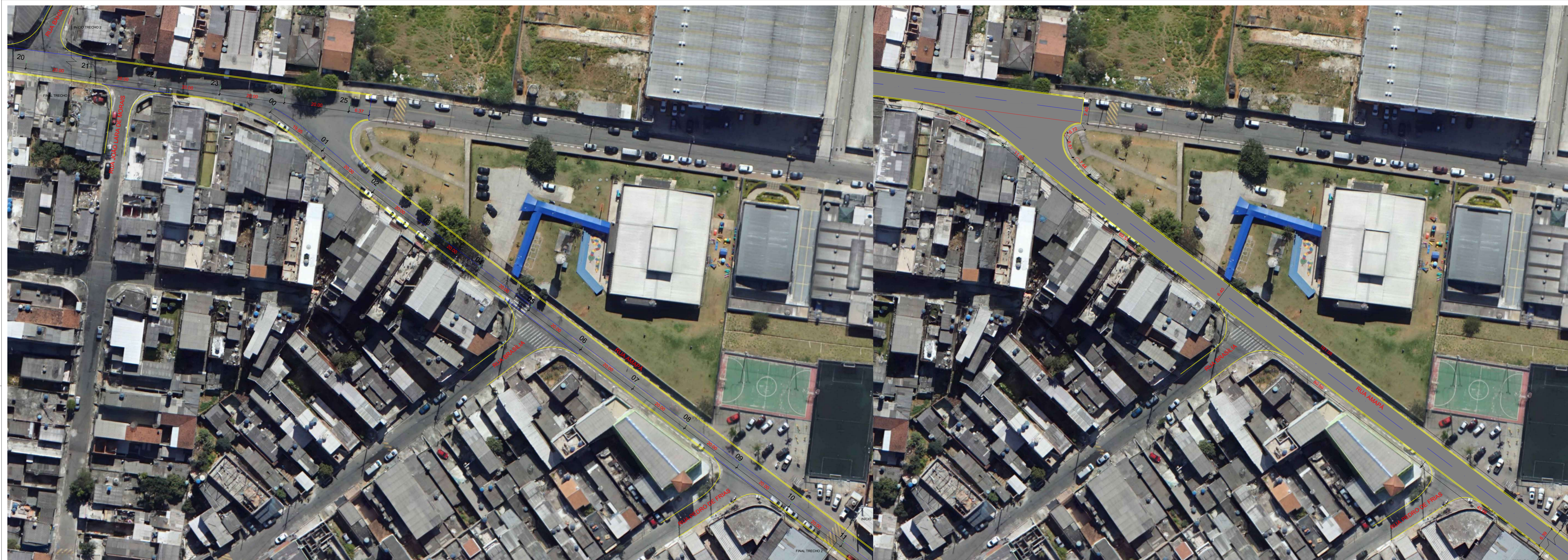
PLANTA DE ESTAQUEAMENTO - TRECHO 2 ESCALA 1:500