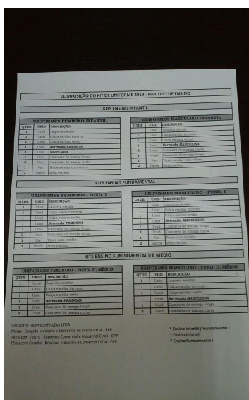
composição do kit de uniforme